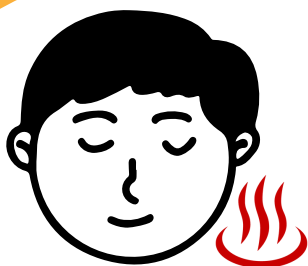
若者ケアラーさん

認知症の家族と向き合ってきた子ども世代の若者たちは、家族のケアと学業、仕事など自身の生活との間で葛藤し、介護する中で戸惑うことも多くあります。そうした思いを安心して話せる場として、私たちは「まりねっこ」を開いてきましたが、当事者の声により広く知られてほしい、若いケアラーが話しあえる場について知っていただきたいと、本シンポジウムを企画しました。